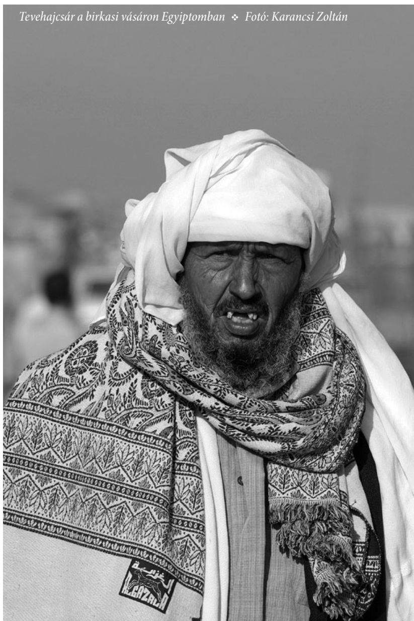
Tevehajcsár a birkasi vásáron Egyiptomban

A világháború előestéjén teljes mértékben érvényesül a francia hegemonia a Maghreb országokban. *