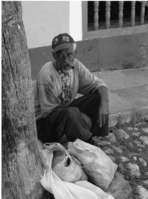
FOTO Descanso ❖ La foto fue tomada por Emese Baranyi en Trinidad, 2010.