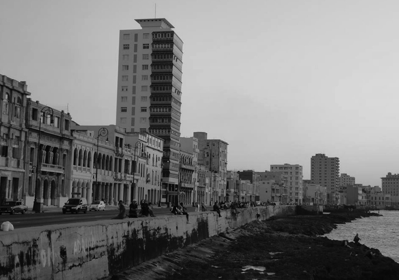
FOTO Malecón (Avenida de Maceo) en La Habana